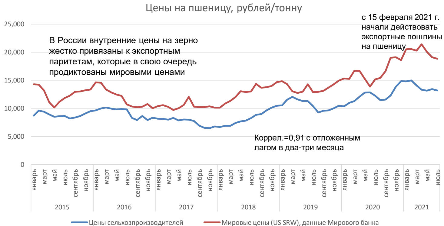
Возможные внутренние цены без пошлины, рублей/тонну